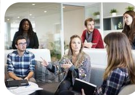
PORADENSTVÍ A DOHLED