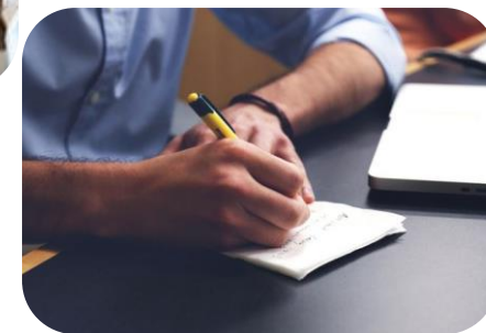
DPO / POVĚŘENEC